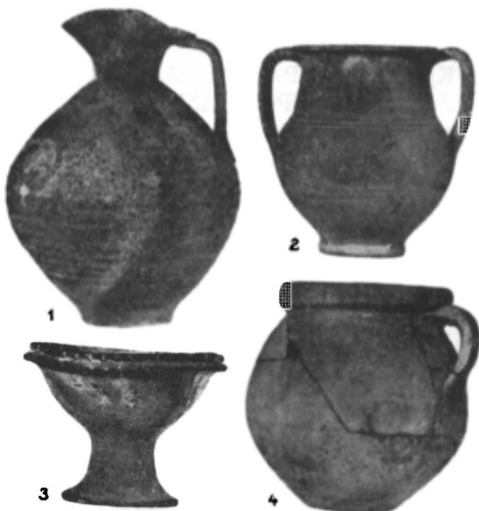
Fig. 1. — 1—2, vase din mormîntul de înhumare m 4; 3—4, vase din mormîntul de incinerare m 8 din M XXV.

În afară de morminte s-au aflat pe solul antic, într-un strat de cenușă în M XXXI, foarte multe fragmente de la vase mici din pastă roșie, împrăștiate pe o suprafață de aproape 1 m 2 . Fuseseră aici sparte pe locul unei vetre de sacrificiu, cănuțe cu o tortiță, străchioare cu pereții bombați și suport inelar, farfurioare cu pereții mici verticali și suport inelar, toate de factură romană, folosite probabil la un ospăț funerar.