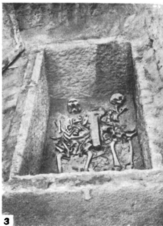
Fig. 2. 1, profilul estic de la M VI; 2, mormîntul de incinerare m 6 din M VI; 3, sarcofagul m 4 din M V.